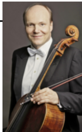
Truls Mørk, violoncelliste norvégien de génie, jouera le 2 mars à Genève.

Salle Centrale Madeleine à 20 h. Vente des abonnements jusqu'au 30 août au Service culturel Migros Genève. Plus d'infos sur www.culturel-migros-geneve.ch ou sur demande au 058 568 29 00.